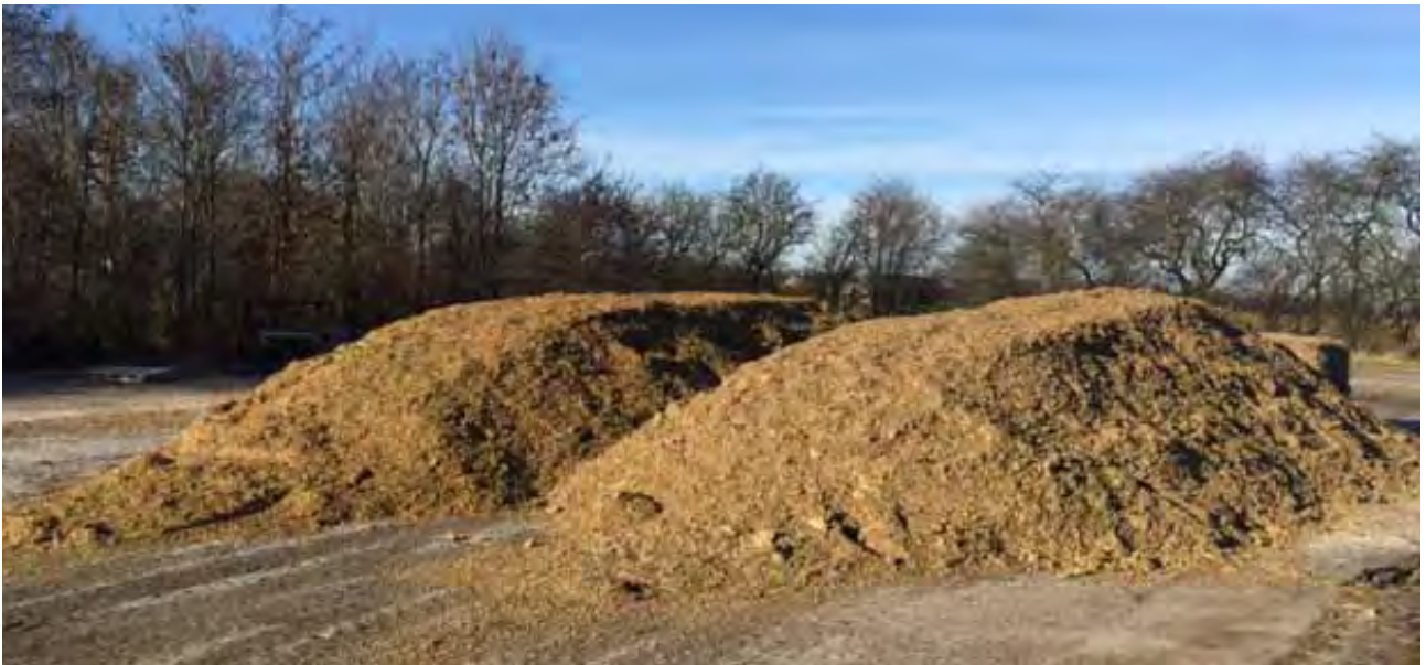
Et par af de indkomne majspartier.

En fodringsstest, udført ved Danmarks Kvægforskningscenter, skal give os mere viden om, hvor meget foderoptagelse og mælkeydelse påvirkes af NDF fordøjeligheden i majsensilage. Det testes også, om effekten af NDF fordøjelighed i majs er påvirket af foderets blandingsgrad og dermed om ekstra blandetid kan ophæve en forventet negativ effekt af lav fordøjelighed.