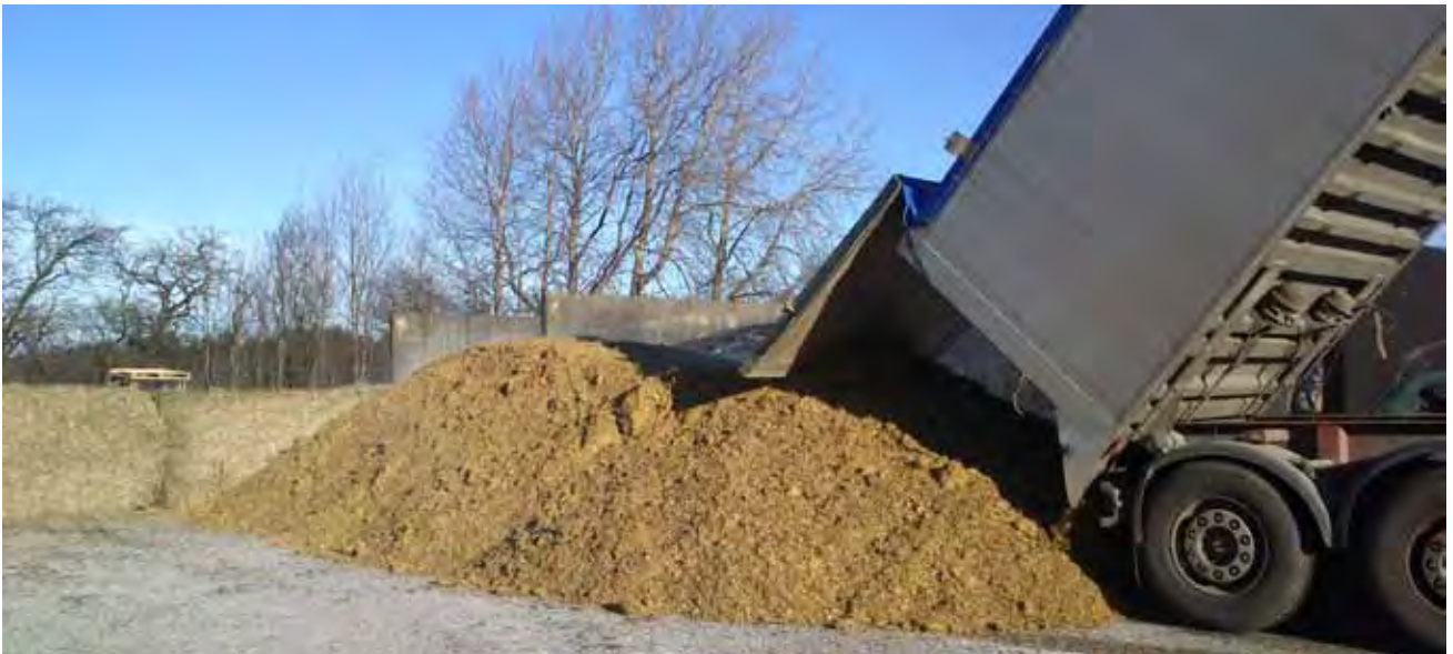
Et parti majsensilage læsses af.

i wrapballer til udfodring i testperioden. Foderrationerne er sammensat med henblik på at afspejle en typisk dansk malkekoration. Rationen varierer alene på FK-NDF i majsensilagen.